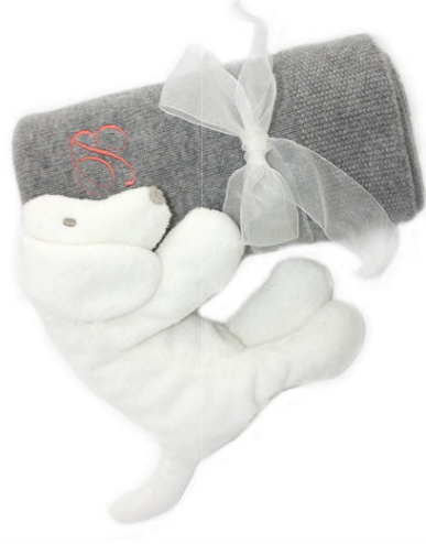
Coffret « Plaid 100% Cachemire et Dou dou » BebeCachemire / Dimpel